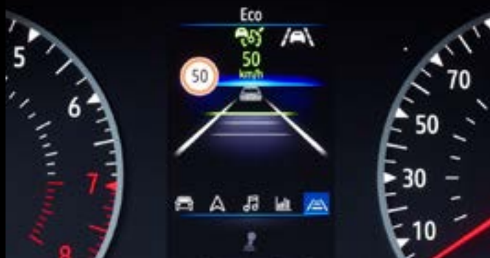
▲ System rozpoznawania znaków drogowych

wyposażenie standardowe o wartości 6 000 zł bez dopłaty oraz rabat cenowy do 5 000 zł