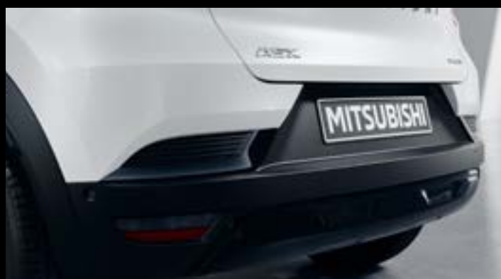
▲ Czujniki parkowania z tyłu