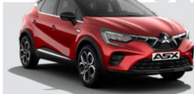
1.3 M Hybrid 7DCT Intense + Style + Cold