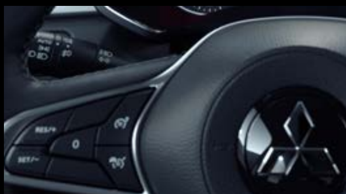
▲ Tempomat z ogranicznikiem prędkości

*Szacowana wartość wyposażenia skalkulowana przez Astara Poland Sp. z o.o. w odniesieniu do specyfikacji Invite+Style oraz wyposażenia konkurencyjnych modeli w tym rabat cenowy do 5 000 PLN. W pozostałej części korzyść stanowi szacowaną wartość wliczonego w cenę wyposażenia skalkulowaną przez Astara Poland Sp. z o.o. w odniesieniu do specyfikacji Invite+Style oraz dodatkowo płatnego wyposażenia konkurencyjnych modeli innych marek. Rabat cenowy liczony jest od ceny katalogowej i obowiązuje przy skorzystaniu z finansowania w Santander Consumer Multirent lub Santander Consumer Banku oraz przy zakupie u Dealera pakietu ubezpieczeń komunikacyjnych w PZU lub Warta.