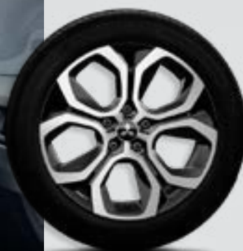
Felgi 18 calowe aluminiowe