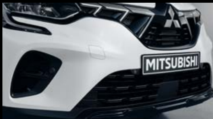
▲ Czujniki parkowania z przodu