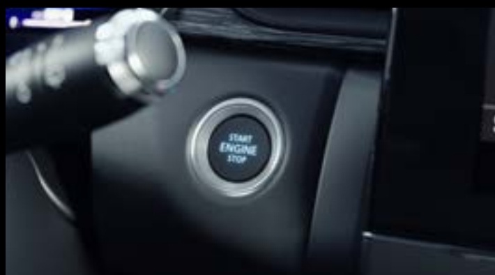
▲ System bezkluczykowy