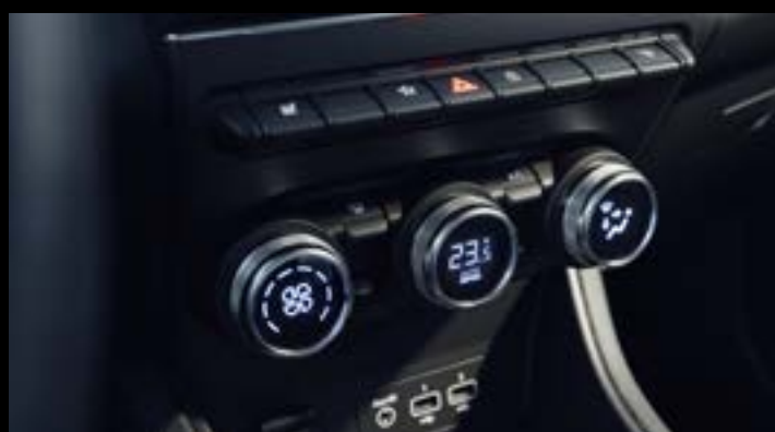
▲ Klimatyzacja automatyczna