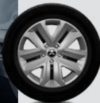
Felgi 17 calowe typu flex