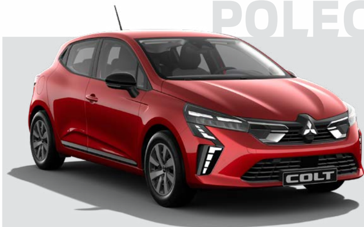
1.0T LPG Invite